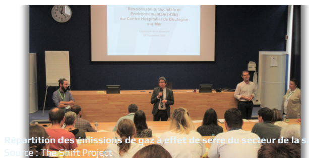
Répartition des émissions de gaz à effet de serre du secteur de la santé

Plusieurs projets seront lancés dans les prochains mois.