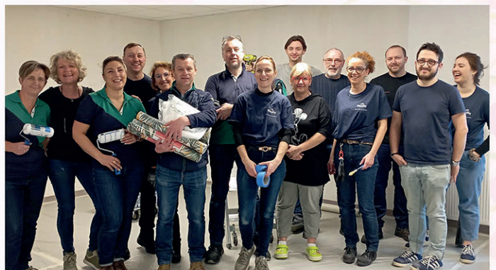
L'équipe du chantier solidaire de Leroy Merlin