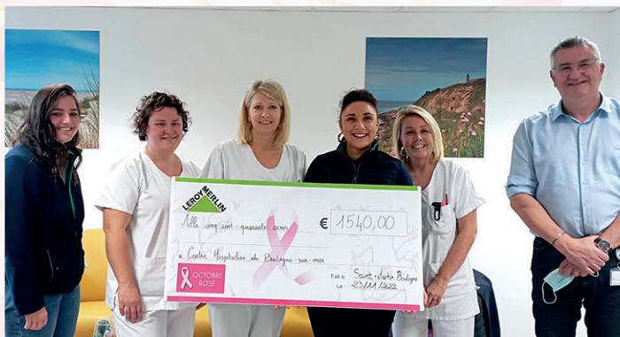
Remise de chèque par Leroy Merlin St-Martin Boulogne