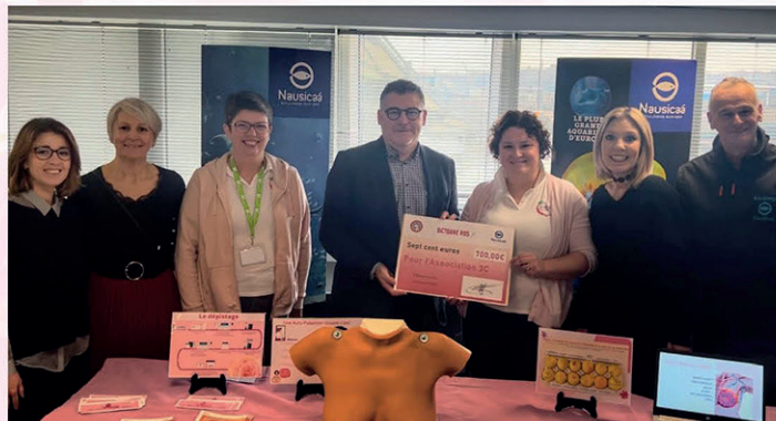
Intervention du CHB sur l'autopalpation à Nausicaà