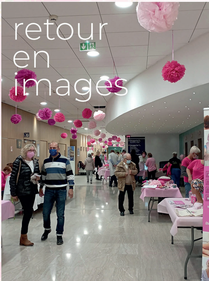
Journée d'information dans le hall du CHB